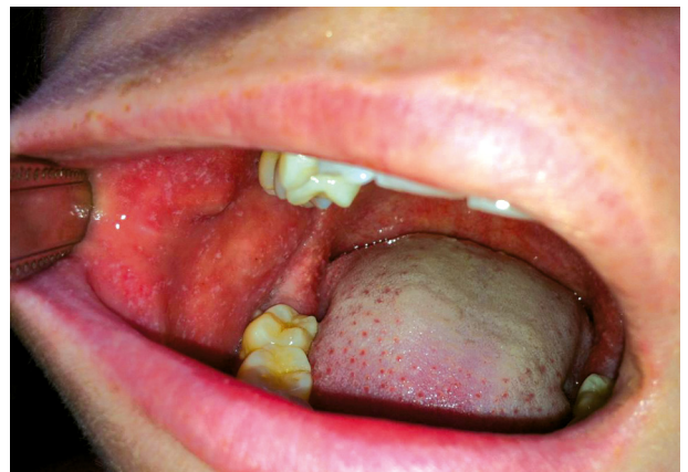
FIGUUR 2 Foto van het wangslimvlies van een patiënt met mazelen. Op het rode wangslimvlies zijn koplik-vlekken zichtbaar: witte, speldenknopgrote vlekjes die pathognomonisch zijn voor mazelen.

Mazelen kenmerkt zich door een acuut optredende algehele malaise, koorts, conjunctivitis, rinitis en hoesten. De koorts neemt in de loop van enkele dagen toe tot boven de 39°C. 3 tot 7 dagen na het begin van de klachten ontstaat een grofvlekkig, iets verheven exantheem, dat begint op het hoofd, meestal achter de oren, en zich vervolgens in enkele dagen uitbreidt naar romp en ledematen (figuur 1). Vaak voelt de huid wat ruw aan en soms is er jeuk. Het exantheem is soms lastig te onderscheiden van andere virale exanthenen. 4 Na enkele dagen verbleekt het exantheem, dat meestal 7 tot 10 dagen zichtbaar is. Pathogno-