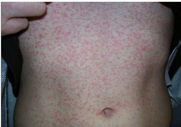
FIGUUR 1 Foto van een patiënt met iets verheven exantheem bij mazelen.

Mazelen (morbilli) is een virale infectieziekte, die zich voornamelijk door de lucht verspreidt via druppels uit neus- en keelholte. Mazelen kent een bifasisch verloop. In de eerste fase infecteert het virus de luchtwegen en vindt lokale vermeerdering plaats in de lymfoïde weefsels.