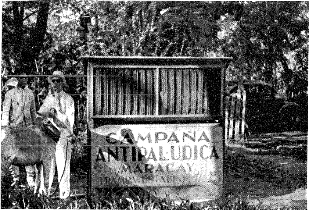
Fig. 21. Muskietenval, ter bepaling der muggendichtheid van een bepaald gebied, vóór en na de assaineering.