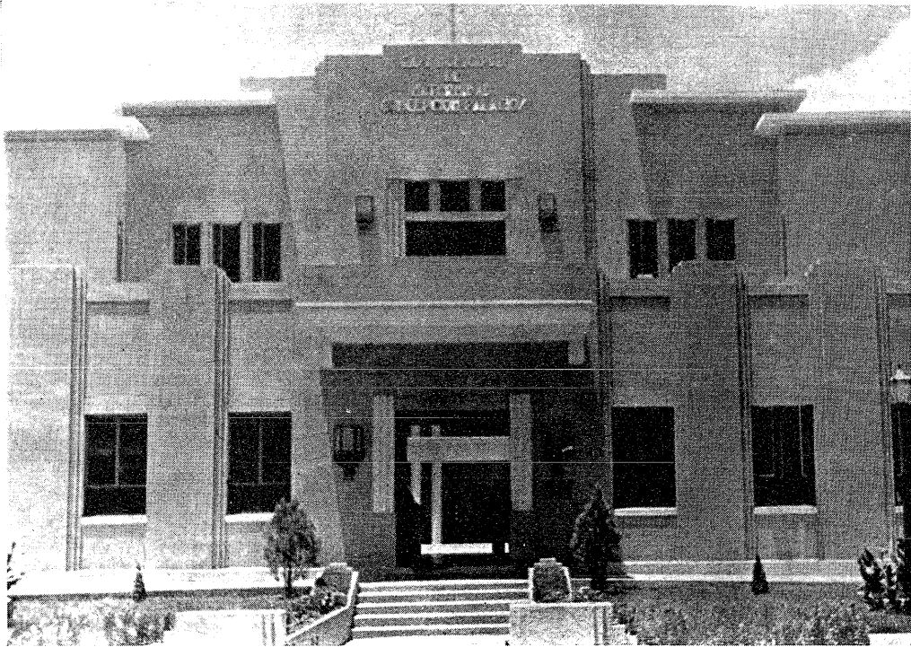
Fig. 23. De nieuwe maternité in Caracas.