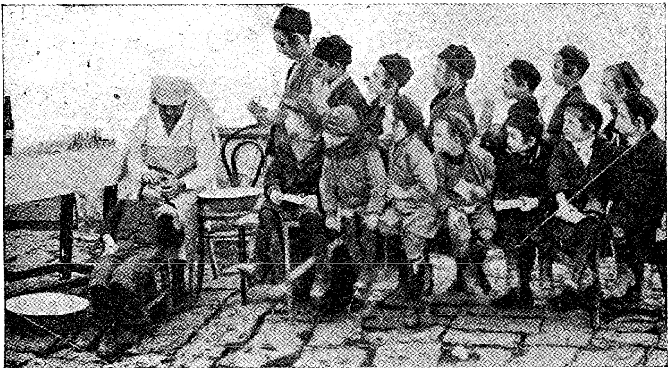
Bestrijding van trachoom in de scholen.

Droevig bleef evenwel de algemeene toestand op hygiënisch gebied, totdat de Amerikaansche vereeniging Hadassah haar intrede deed, voornamelijk ondersteund door NATHAN en LINA STRAUS. Behalve het ziekenhuis, dat nu nog in oude gebouwen is geherbergd, welke evenwel gaandeweg door nieuwe worden vervangen, staan onder de hoede der vereeniging policlinieken op ieder gebied, consultatiediensten voor zwangere vrouwen, jonge kinderen, schoolhygiëne, oogen-